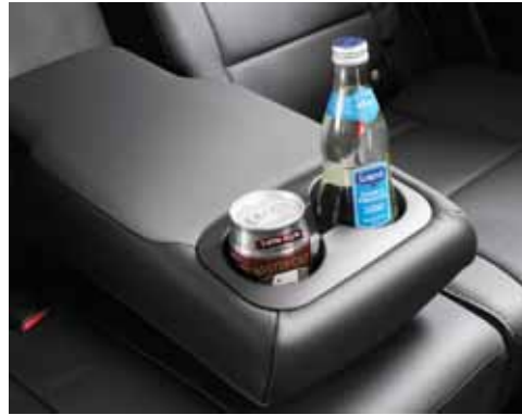
Posavasos en consola central trasera.