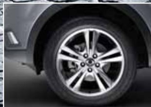
Llantas de aleación aro de 17".