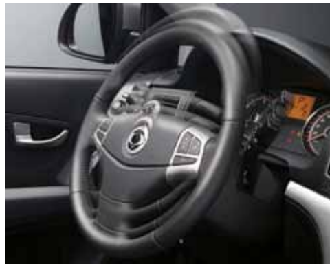
Volante multifunción regulable.