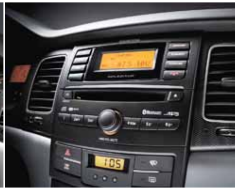
Radio Digital/CD/MP3. Control de audio en el volante.