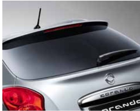
Privacy Glass (vidrios traseros oscuros)