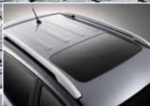
Rielos portaequipajes en el techo.