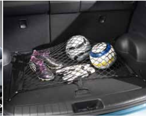
Maletero de gran capacidad.