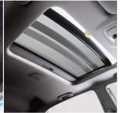
Techo solar corredizo eléctrico (Versión 4x4)