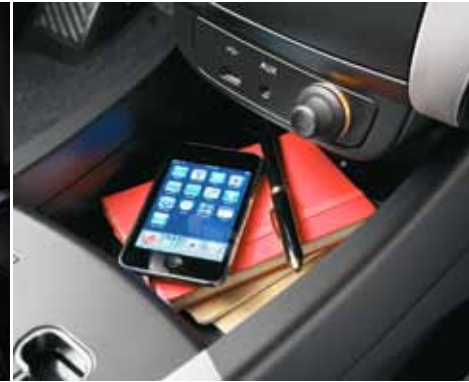
Puerto USB y entrada auxiliar.