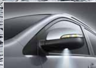
Luz de cortesía LED exterior en retrovisores.