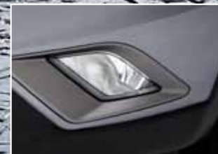
Faros neblineros delanteros.