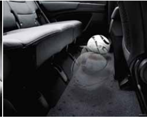
Suelo plano en segunda fila de asientos.