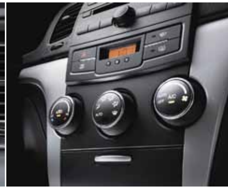
Aire Acondicionado/Calefacción con Climatizador Automático.