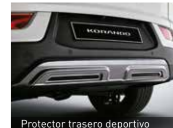
Protector trasero deportivo

Sincroniza tu smartphone con la pantalla para acceder a sus funciones mediante comandos de voz o mediante la pantalla táctil, gracias a los sistemas Apple CarPlay® y Android Auto®.