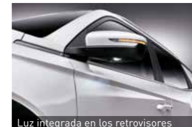
Luz integrada en los retrovisores

Automática Secuencial 6 vel. destaca ofreciendo una conducción suave.