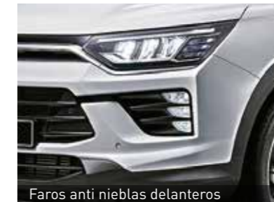
Faros anti nieblas delanteros

Un alerón trasero deportivo que incorpora luz de freno LED.