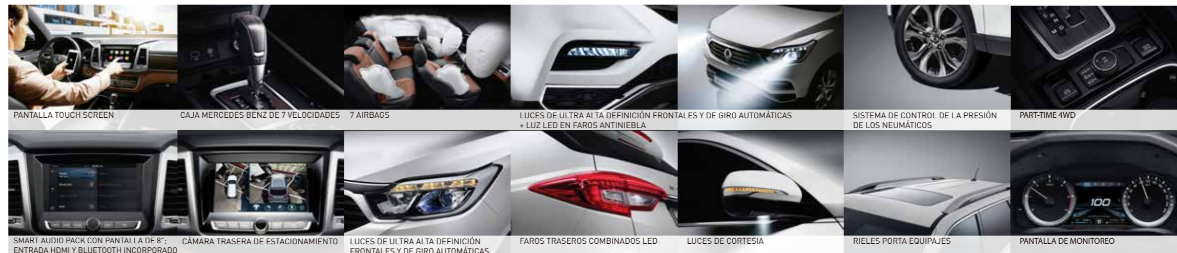
PANTALLA TOUCH SCREEN