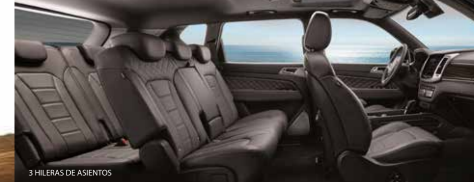
3 HILERAS DE ASIENTOS