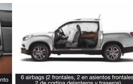
6 airbags (2 frontales, 2 en asientos frontales, 2 de cortina delanteros y traseros)

REXTON PICKUP ES MÁS GRANDE, FUERTE, TECNOLÓGICA, AMPLIA Y MÁS COMODA QUE LAS DEMÁS. COMPROBALO.