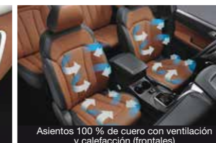
Asientos 100 % de cuero con ventilación y calefacción (frontales)