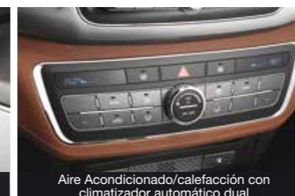
Aire Acondicionado/calefacción con climatizador automático dual