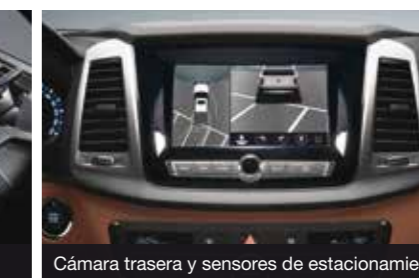
Cámara trasera y sensores de estacionamiento