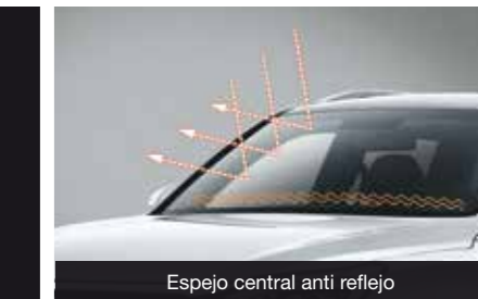
Espejo central anti reflejo

REXTON PICKUP ES MÁS GRANDE, FUERTE, TECNOLÓGICA, AMPLIA Y MÁS COMODA QUE LAS DEMÁS. COMPROBALO.