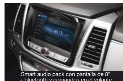
Smart audio pack con pantalla de 8" + bluetooth y comandos en el volante