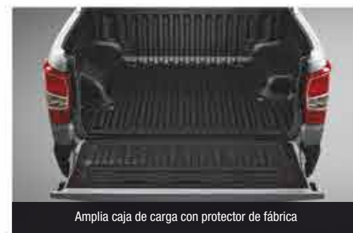
Amplia caja de carga con protector de fábrica