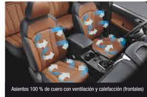
Asientos 100 % de cuero con ventilación y calefacción (frontales)