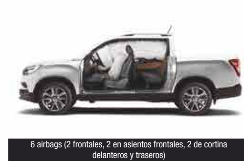
6 airbags (2 frontales, 2 en asientos frontales, 2 de cortina delanteros y traseros)