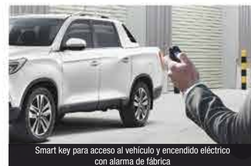
Smart key para acceso al vehículo y encendido eléctrico con alarma de fábrica