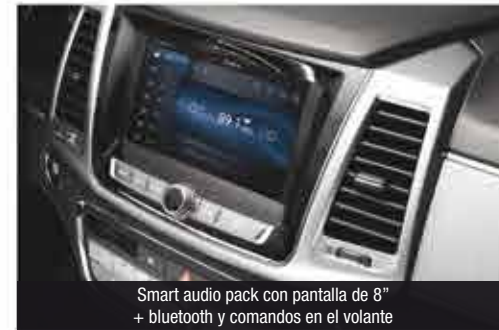
Smart audio pack con pantalla de 8" + bluetooth y comandos en el volante

La nueva Ssangyong Rexton Sports redefine el concepto de Pick up con sólidos fundamentos. El confort, la elegancia y su tecnología la distinguen, además de su potencia y gran capacidad de desempeño en diversos usos, como el campo, el trabajo o las necesidades cotidianas en la ciudad.