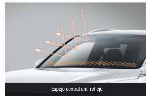
Espejo central anti reflejo