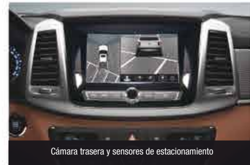
Cámara trasera y sensores de estacionamiento