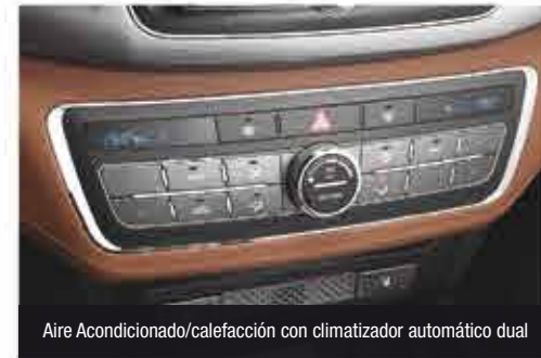
Aire Acondicionado/calefacción con climatizador automático dual